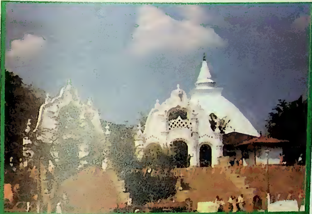
කැලණි රජමහ වෙහෙර පුදබිම