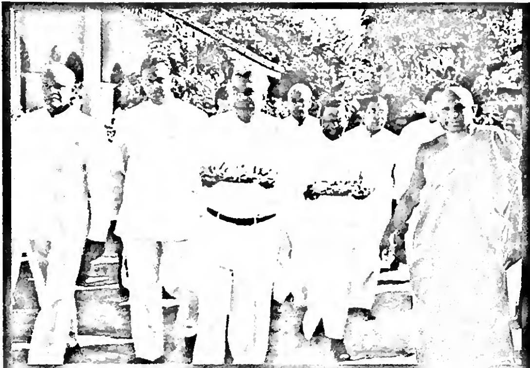
සැලැහැ සිටින මුදු පුදුම...