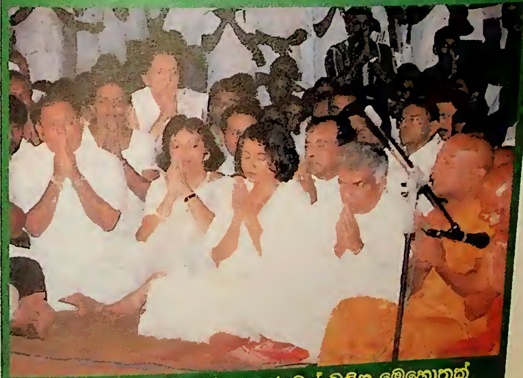
උතුම් බොදු පවුලක් - තෙරුවන් වැදින මෙහොතක්