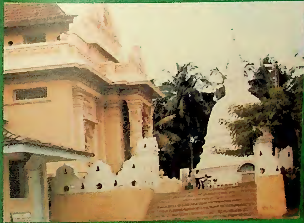
කෙල්ලන්විල රජමහ විහාරය