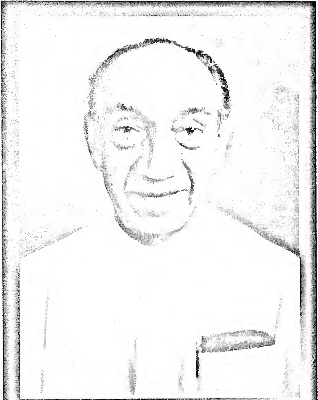
1970-77 යුගයේ ආරාපික වී ගිය දේශය නිමහල් දැහැවී යූගයක් කරා මෙහෙයවූ හිටපු ජනාධිපති ජේ. ආර්. ජයවර්ධන මැතිතුමා