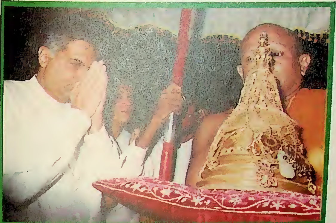
කෙනෙකු ලෙස යහපත් - ආ කරඬුවෙන් ලැබ සෙත්