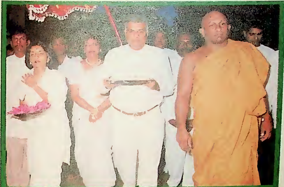
මුදු පුදුම යන්නේ - දැනැමි බව මතුවන්නේ