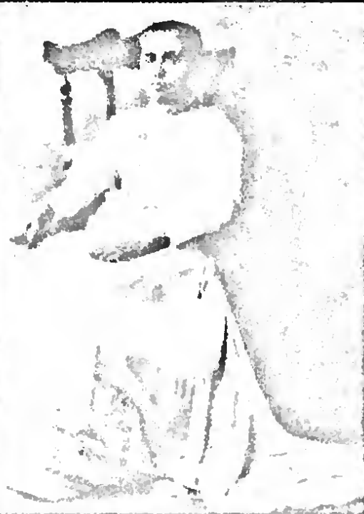
ශ්‍රී ලංකා විප්ලව්‍යය සහ හෙලෝ විප්ලවය යුගය