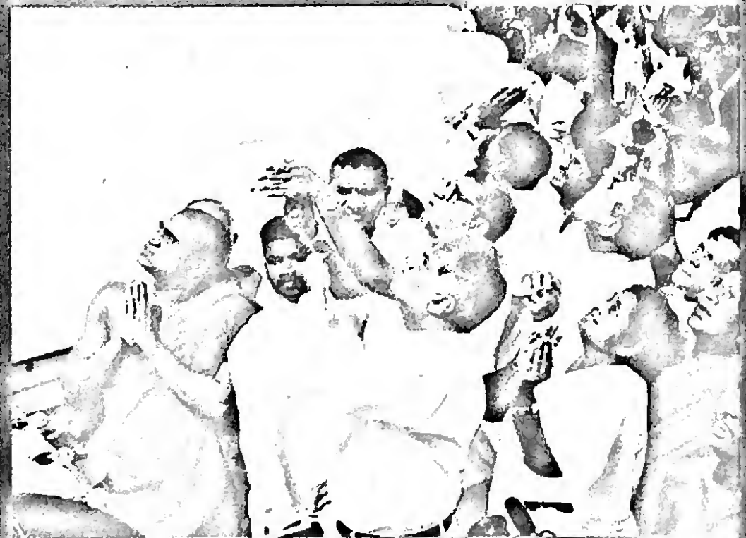
කොත විවර මෙනවා - දහම් සිහිවිලි ජෝරෙ සනවා