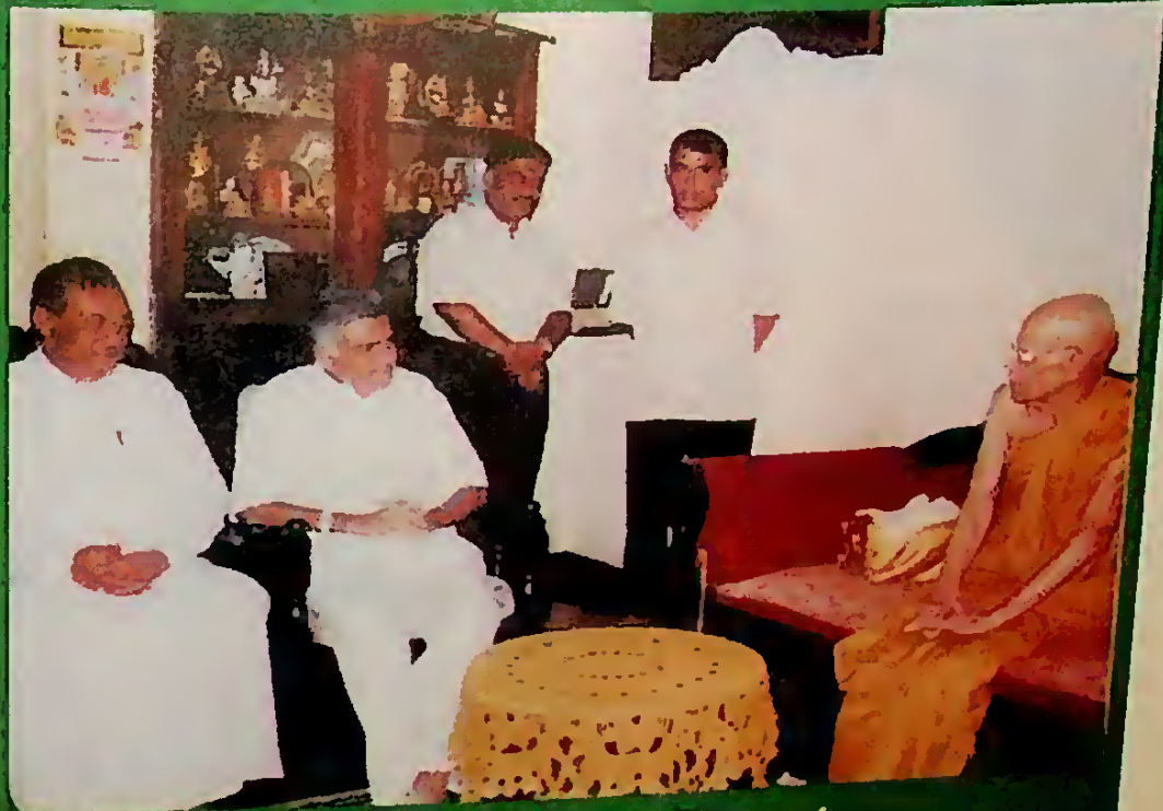
මහ නාහිමියන් සමග පිළිසඳරක...