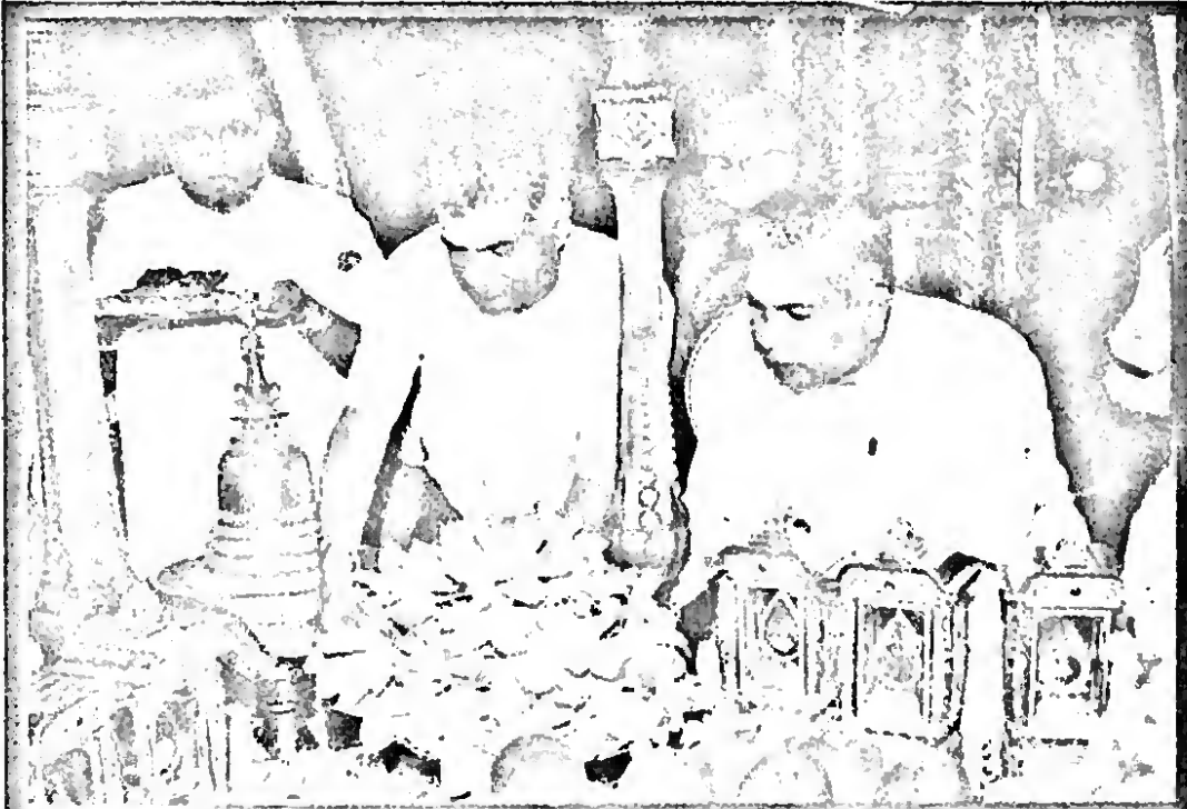
දේශප්‍රේමී ආගමිකයන් - ඉන්දියානු ජනපති පදවි ආනුභවය