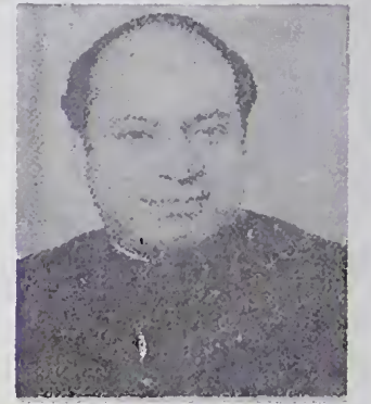
නවාස් ජට්ප් (පාකිස්ථාන අගමැති)

කොළඹදීය. ඒ 1981 අප්‍රේල් මාසයේදීය. එතැන් පටන් සාක් සංවිධානය පිළිබඳ ප්‍රාරම්භක