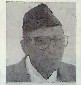
ගිරිපා ප්‍රසාද කොයිච්චේ (තේපාල අගමැති)

සාක් සංවිධානයේ ක්‍රියා ශීලිත්වයට ඉතාම ව්‍යක්ත නිදර්ශනයක් සැපයෙන්නේ 'සාක්' ධාන්‍ය සංවිනයක් පිහිටුවාලීමේ ශීවිසුමෙනි. මේ ශීවිසුම අත්සන් කරන ලද්දේ 1987 නොවැම්බර් මාසයේදී ඔන්මණ්ඩුවේ සාක් රාජ්‍ය නායක සමුළුව පැවැත්වූ අවස්ථාවේදීය. ඉන් නව මසකින් පසුව, 1988 අගෝස්තු මාසයේදී ඒ ධාන්‍ය සංවිනය පිහිටුවන ලදී. ඉතා ඝෞරව ලෙස අදහස් යෝජනා ආදිය ක්‍රියාවේ යෙදවීමෙහිලා, සාක් සංවිධානය සතු ප්‍රවීණත්වයට මෙය