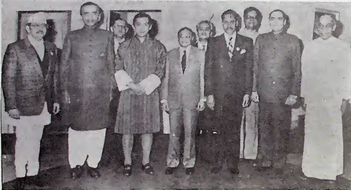
1987 ඉන්දියාවේ බංගලෝර් හි පවති සාක් රාජ්‍ය නායක සමුළුවට සහභාගි වූ රාජ්‍ය නායකයෝ

සාක් සංවිධානය විසින් එහි උදාරතර පරමාර්ථ ඉටුකොට ගෙන