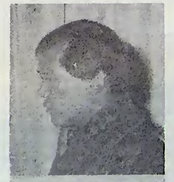
ජග්මේ සිංග්ගේ වංග්ගුක් රජු (බුතානයේ රජු)

විසින්, සහයෝගිතා ව්‍යාපාර මගින් මේ රාජ්‍යයේ ප්‍රගතිය ජව ගැන්වීමයි. සාක් සංවිධානයෙන් මුර්තිමත් වන්නේ සිය පොදු ප්‍රශ්න නිරාකරණය කොට ගැනීමෙහිලා කලාපීය මට්ටමෙන් සහයෝගිතා