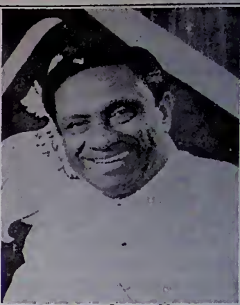
ශ්‍රීමත් රණසිංහ ප්‍රේමදාස ජනාධිපතිතුමා

ඒවා මෙසේය: 1. කවර මට්ටමකින් හෝතිරණවලට එළඹිය යුතු වන්නේ ඒකමතික භාවය පදනම් කොට ගෙනයි. 2. අනෙකුත් ප්‍රශ්න සහ විවාදයට තුඩුදෙන සුළු ප්‍රශ්න, සාකච්ඡා සඳහා ගතයුතු නොවේ.