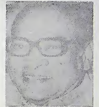
තරසිංහ රාවේ (ඉන්දියානු අගමැති)

සංවිධානය ස්ථාපිතව පිහිටියාට පසුව, කවර ආකාරයක හෝ කියුණු මතභේදයකට වුවද, ඔරොත්තු