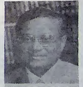
මවුසුන් අබ්දුල් ගසුම් (මාලදිවයින ජනාධිපති)

1991 දෙසැම්බර් 21 වනදා කොළඹදී සාක් සටන රාජ්‍ය නායක