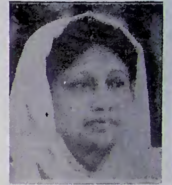
බෙගම් කලීඩා මියා (බංගලාදේශ අගමැති)

මේ පෘථුල ප්‍රතිපත්ති සකස්කොට ගන්නා ලද්දේ සංවිධානයේ ස්ථාපිත භාවය රැකගන්නා පිණිස බැවි