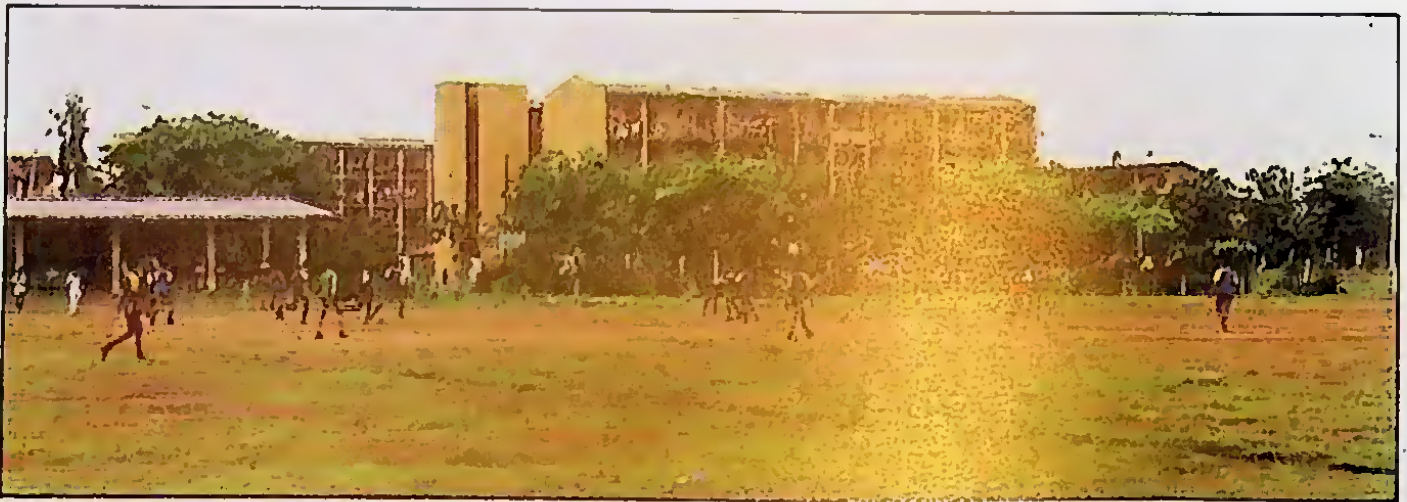
සිංග ක්‍රීඩා පහසුකම් - විද්‍යාලයේ ක්‍රීඩාංගණය. උසස් ගාලදොර පිහිටි පී. ඩී. සිරිසේන ක්‍රීඩාංගනය, නිවාස ක්‍රමයේ සතු ක්‍රීඩාංගනය වේ. උභි සියලු ක්‍රීඩා කටයුතු සඳහා අප්‍රසංසකරන පහසුකම් තිබේ.