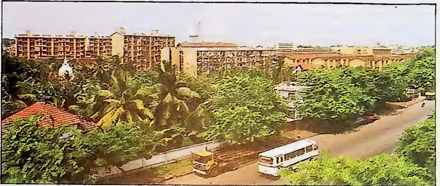
කිලාස 1470 කින් සමන්විත අංගසම්පුර්ණ පුරරටසක්.