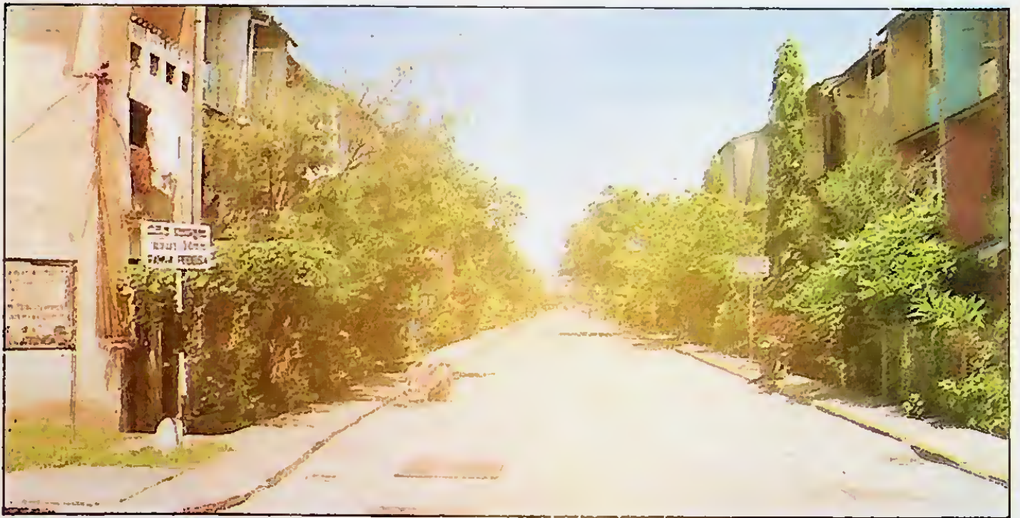
සිසව පොල පහසුකම් - කුළුක් මාර්ග පදිංචි හා ජල පහසුකම් ලබා ඇති මාලිගාරත්ත නිවාස කුමස පොහොසත්ය.