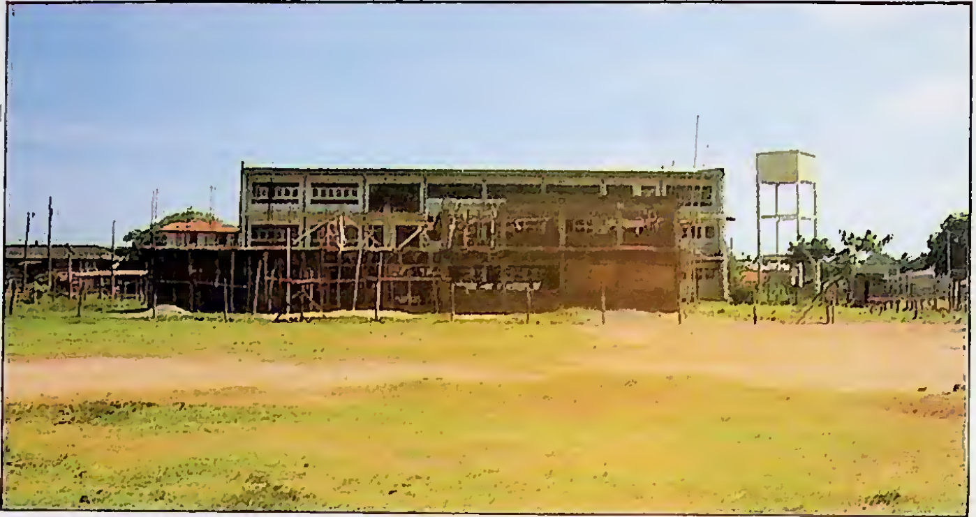
නිවාසලාභීන්ගේ දරා - දැරියන්ට සිප්සතර ඉගෙනීම සඳහා පාසලක් - ශ්‍රීමත් බාගොන් ජයතිලක මහා විද්‍යාලය. මෙම නිවාස ක්‍රමය හා ඊ අවට වැසියන්ගේ දරා - දැරියන්ට මූලික අධ්‍යාපනය ලබාදීම සඳහා සකස් වූ උග්‍රසම්පූර්ණ පාසලකි.