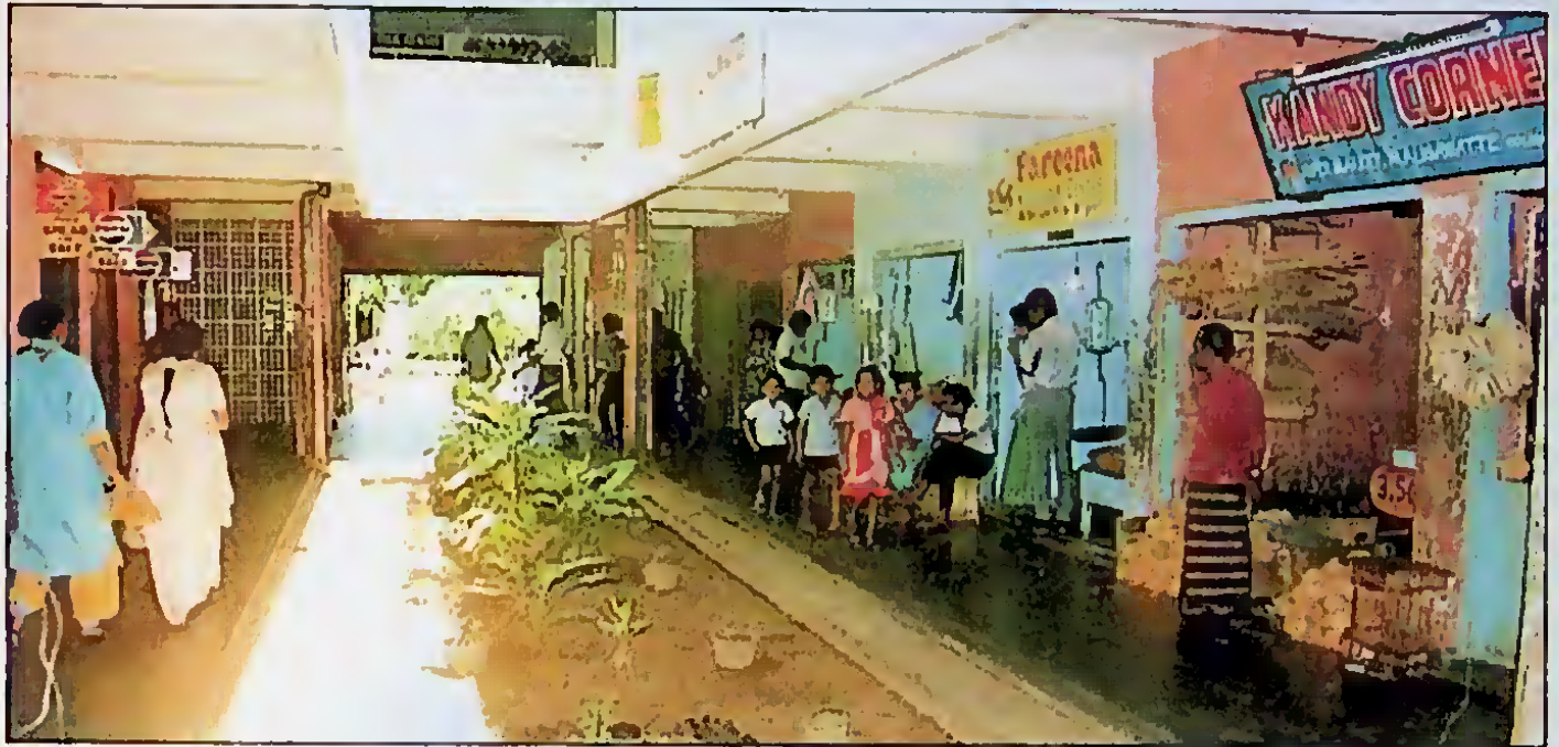
දෛනික ජීවන පහසුම සඳහා - පෙළඳ සංකීර්ණය, පොදු නාන ලීඳ මාලිගාවත්ත නිවාසීයන්ගේ දෛනික දිවිය වඩාත් පහසු කරයි