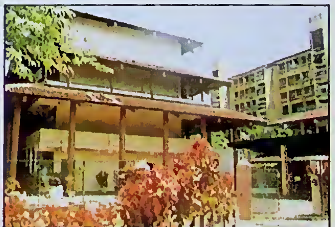
මාලිගාවත්ත පුරවරයට නව වලියක් ගෙනදුන් රජයේ කාර්යාල

ධීර අමාත්‍යාංශය උප්පාත්ත, විවෘත හා මරණ රෙජිස්ටාර් කාර්යාලය, ජාතික නිවාස දෙපාර්තමේන්තුව අධ්‍යාපන ප්‍රකාශන දෙපාර්තමේන්තුව ඇල මාර්ග සංවර්ධන අංශය පොදු පහසුකම් මණ්ඩලය සෞඛ්‍ය සේවා අධිකාරිය පැපාලේ කාර්යාලය නගර හා ග්‍රාම නිර්මාණ දෙපාර්තමේන්තුව මධ්‍යම පරිසර අධිකාරිය.