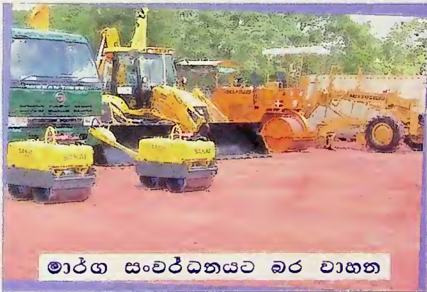
මාර්ග සංවර්ධනයට බර වාහන

සංඛ්‍යාත්මකව 31,000 කට වැඩි මෙම ග්‍රන්ථ එකතුව ඉන්දියාවේ තමිල්නාඩු ප්‍රාන්තයේ ප්‍රසිද්ධ පොත් ප්‍රකාශකයින් අතර සිටින U.V ස්වාමිනාදන් අසියර් පුස්තකාලය, පුරාවිද්‍යා ජාජ්‍ය දෙපාර්තමේන්තුව, තත්පෝර් ද්‍රවිඩ විශ්ව විද්‍යාලය හා සුරස්වති මහල් එකතුව තුළින් ලබාගෙන ඇති අතර නාට්‍ය කලාව නැටුම්, සංගීතය, දර්ශනය, දෙමළ, ඝාගිතය, වාග් විද්‍යාව, ආගම ඉතිහාසය, සමාජ විද්‍යාව, සංස්කෘතිය, නීති විද්‍යාව සහ වෛද්‍ය විද්‍යාව ආදී විෂය ක්ෂේත්‍රයන්ගෙන් සමන්විතය