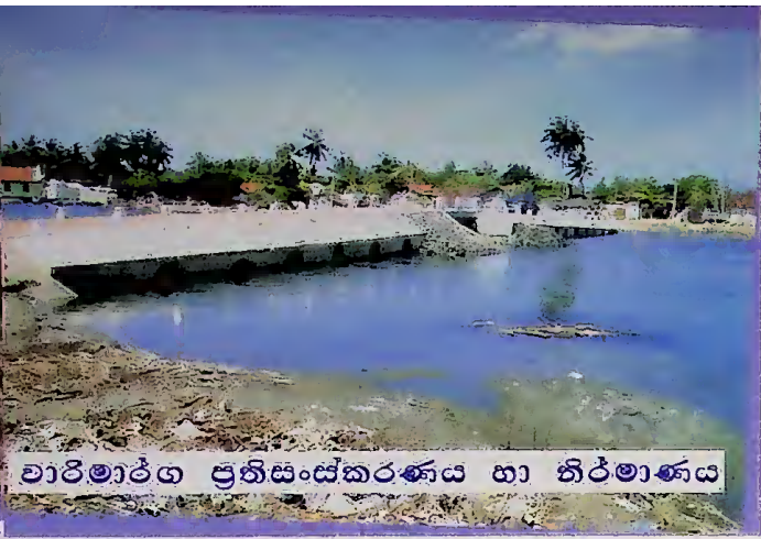
වාරිමාර්ග ප්‍රතිසංස්කරණය හා නිර්මාණය