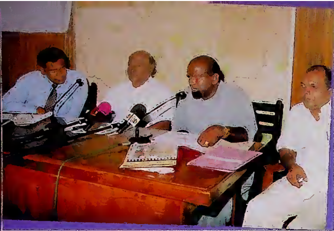
ජාතිය ගොඩනැගීමේ හා සංවර්ධනය කිරීමේ නියෝජ්‍ය අමාත්‍ය ගරු ද.මු. දසනායක මැතිතුමා උතුරු නැගෙනහිර සංවර්ධනය පිළිබඳ සාකච්ඡා කරමින්

උතුරු නැගෙනහිර සහ දකුණු පළාත්හි සුනාමි ප්‍රතිසංස්කරණ කටයුතු කඩිනම් කිරීමේලා ඉතාලී රජයෙන් ජාතිය ගොඩනැගීමේ හා සංවර්ධනය කිරීමේ අමාත්‍යාංශය වෙත ලබාදුන් රු.මිලියන 370 ක් වටිනා බර වාහන ඇතුළු යන්ත්‍රෝපකරණ 51 න් 26 ක් උතුරු නැගෙනහිර පළාත් සභාවේ මාර්ග සංවර්ධන දෙපාර්තමේන්තුව වෙත ලබාදීමේ මුල් අදියර පැලියගොඩ ගබඩා අංගනයේදී සිදු කෙරිණි. යන්ත්‍රෝපකරණ තොගය අතර ටිපර් රථ, කැබ් රථ, මෝටර් රථ, මෝටර් ශ්‍රේදර්, ගල් රෝලර, හා බැකෝ ලෝඩර් ආදී විවිධ මාදිලියේ යන්ත්‍ර විය.