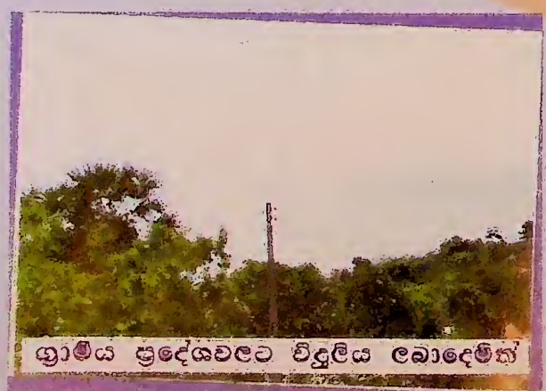
ශ්‍රාමීය ප්‍රදේශවලට විදුලිය ලබාදෙමින්

අඩි ගැටුමෙන් පීඩනයට පත් ප්‍රදේශ විශේෂිත කොට යෝග්‍ය ප්‍රතිපත්ති , වැඩසටහන් සහ ව්‍යාපෘති ක්‍රියාත්මක කිරීමෙන් මෙරට පැවති සාමකාමී පරිසරය නැවත ඇතිකිරීමට ආයතනවල පරිසරයක් ගොඩනැගීම, ප්‍රතිසන්ධානය සහ ජනවාදීක, සුභදර්ශී ප්‍රවර්ධනය මගින් සමාජ ආර්ථික සංවර්ධනය පෝෂණය කිරීම සහ සියලු ප්‍රජාවන්ට සමාන අවස්ථා ලැබීම සහතික කිරීම