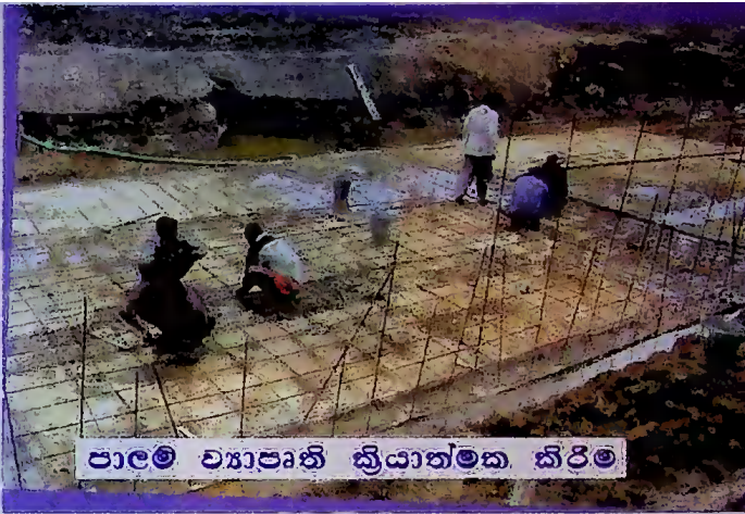
පාලම් ව්‍යාපෘති ක්‍රියාත්මක කිරීම

මෙම ව්‍යාපෘති ක්‍රියාත්මක කිරීම සඳහා 2006 වසරට භාණ්ඩාගාරයෙන් වෙන් කර ඇති මුළු මුදල රු. මිලියන 1657 කි. එම අරමුදල් පහත දැක්වෙන පරිදි ඒ ඒ දිස්ත්‍රික් සඳහා වෙන්කර ඇත.