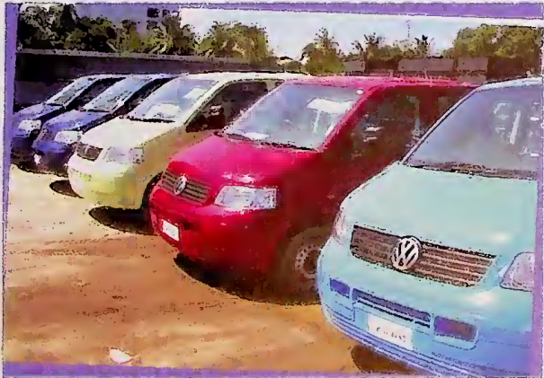
සුනාමි ව්‍යසනයෙන් විනාශ වූ උතුරු නැගෙනහිර ප්‍රදේශ සංවර්ධනය සඳහා ඉතාලී රජයෙන් ලබාදුන් මෝටර් රථ හා බර වාහන

මෙම අවස්ථාවට ජර්මන් තානාපති ජර්න් වර්න් මහාතාන් ජර්මන් තාසලනික සහයෝගිතා ආයතනය වෙනුවෙන් එහි නියෝජිත අධ්‍යක්ෂ ආචාර්ය රෝලන්ඩ් එෆ්. ස්ට්‍රවරර් මහාතාන් උතුරු නැගෙනහිර පළාත් සභාවේ ප්‍රධාන ලේකම් එස්. රංගරාජා මහාතාන් සහභාගි විය.