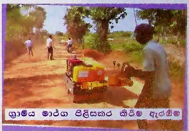
ග්‍රාමීය මාර්ග පිලිසකර කිරීම ඇරඹීම