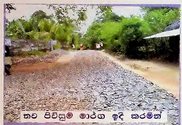
තව පීච්ඤුම් මාර්ග ඉදි කරමින්

සුභසාධක මධ්‍යස්ථාන හා නැවත පදිංචි කිරීමේ ගම්වලට ජලය සැපයීම, පීච්ඤුම් මාර්ග ව්‍යාපෘතිය යටතේ මාර්ග ප්‍රතිසංස්කරණය සහ පාලම් ඉදිකිරීම, සමාජ සුභසාධනය සඳහා ප්‍රජාශාලා ඉදිකිරීම, අධ්‍යාපන ව්‍යාපෘතිය යටතේ පාසැල් ගොඩනැගීමේ ඉදිකිරීම හා ක්‍රීඩාපිටි ඉදිකිරීම, සෞඛ්‍ය ව්‍යාපෘතිය යටතේ සෞඛ්‍ය මධ්‍යස්ථාන ඉදිකිරීම, දිසා රෝහල්වල වාට්ටු සංකීර්ණ ඉදිකිරීම, බාහිර රෝගී ප්‍රතිකාර අංශ වැඩිදියුණුව, මධ්‍යම බෙහෙත් ශාලා සංවර්ධනය, සතිපාරාසක කටයුතු වැඩිදියුණු කිරීම, වාරිමාර්ග ව්‍යාපෘතිය යටතේ ඇලමාර්ග, වැව් අලුත් ප්‍රතිසංස්කරණය ආදී වැඩකටයුතු මෙම කඩිනම් සංවර්ධන ව්‍යාපෘති යටතේ ඒ ඒ දිස්ත්‍රික්කවල යාච්චික මට්ටමින් ක්‍රියාත්මක වේ.