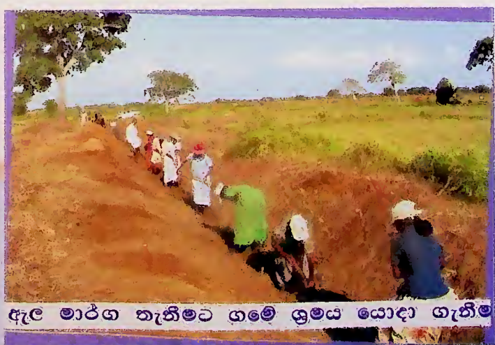
ඇල මාර්ග නැතිමට ගමේ ශ්‍රමය යොදා ගැනීම

ජාතිය ගොඩනැගීමේ හා සංවර්ධනය කිරීමේ අමාත්‍යාංශය අමාත්‍ය :- අතිගරු ජනාධිපති මහින්ද රාජපක්ෂ මැතිතුමා