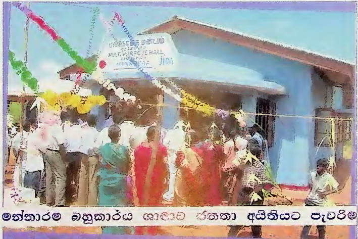
මන්නාරම බහුකාර්ය ශාලාව ජනතා අයිතියට පැවරීම

■ ලෝක බැංකුවේ ආධාර යටතේ උතුරු නැගෙනහිර හානියට පත් ප්‍රදේශවල ජනතාවට සහන ආධාර සඳහා රු මිලියන 100 ක් වෙන් කර ඇත.