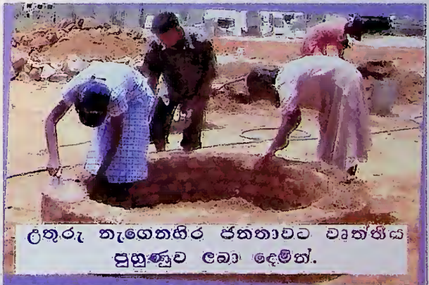
උතුරු නැගෙනහිර ජනතාවට වාත්තිය පුහුණුව ලබා දෙමින්.

ජාතිය ගොඩනැගීමේ හා සංවර්ධනය කිරීමේ අමාත්‍යාංශය යටතේ ක්‍රියාත්මක විශේෂ ව්‍යාපෘති