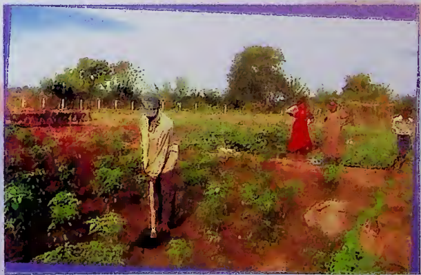
කෘෂිකර්මාන්තයෙහි යෙදී සිටින ප්‍රදේශ වැසියන්

■ ජාතිය ගොඩනැගීමේ හා සංවර්ධනය කිරීමේ අමාත්‍යාංශය හරහා ජර්මන් තාක්ෂණික සහයෝගිතා ආයතනය (GTZ) විසින් රු. මිලියන 5.5 ක වටිනාකමින් යුත් ග්‍රන්ථ එකතුවක් යාපනය පුස්තකාලයට පරිත්‍යාග කිරීම.