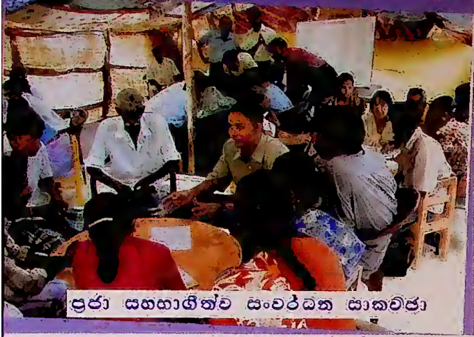
පුජා සහභාගීත්ව සංවර්ධන සාකච්ඡා