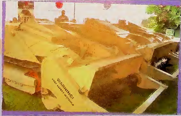
බිම් බෝම්බ ඉවත්කිරීම සඳහා ජපන් රජයෙන් ආධාර වශයෙන් ලැබුණු රු. මි. 177 ක් වටිනා නවීන යන්ත්‍ර 3 ක් අමාත්‍යාංශය වෙත ලබාදීම