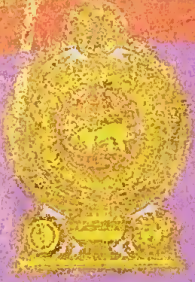
ජාතික ගොඩනැගිලි සහ සංවර්ධන සම්ප්‍රදාය

2004 වසරේ ස්ථාපිත කරන ලද සහන පුනරුත්ථාපන හා ප්‍රතිසන්ධාන අමාත්‍යාංශය ජාතිය ගොඩනැගීමේ හා සංවර්ධනය කිරීමේ අමාත්‍යාංශය නමින් වර්තමාන ආණ්ඩුව විසින් විශේෂයෙන්ම තැවත සකස් කර ඇත්තේ ගැටුමවල කළුපලට යටත් වූ ප්‍රදේශවල ජීවත්වන ජනතාවගේ ප්‍රශ්න විසඳීමටත් ඔවුන් මුහුණපාන දුප්කරතා සමනය කිරීමට හැකි වැඩසටහන් සහ ප්‍රතිපත්ති ක්‍රියාත්මක කිරීමටත්ය. ඒ අනුව ජාතිය ගොඩනැගීමේ හා සංවර්ධනය කිරීමේ අමාත්‍යාංශය විසින් උතුරු නැගෙනහිර දිස්ත්‍රික්ක අටක හා ආශ්‍රිත දිස්ත්‍රික්ක පහක පුනරුත්ථාපන තැවත ඉදිකිරීමේ සහ සංවර්ධනය කිරීමේ ව්‍යාපෘති ක්‍රියාත්මක කරනු ලැබේ. මෙම ව්‍යාපෘති අතර දේශීය අවපුරුල් හා විදේශීය අවපුරුල් කොඳා ක්‍රියාත්මකවන ව්‍යාපෘති ද වේ.