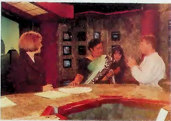
ජනාධිපතිවරයාගේ CNN වාර්තාකරුවන් සමඟ

එල්.ටී.ටී.ඊ. ය 1995 අප්‍රේල් 19 දා ඒක පාර්ශ්විකව