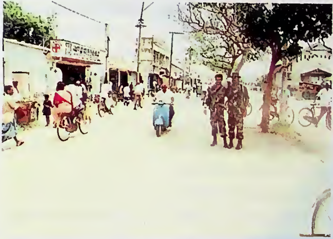
යාපනයේ දුර්ව ධනා නැවතත් එහි පදිංචියට

තර්ක කරන පරිදි යුද්ධය පමණක් ඉදිරියට ගෙන ගියහොත්, ජාත්‍යන්තර වශයෙන් ශ්‍රී ලංකාවට අත්වි තිබෙන කීර්තිය පරදු වී යන්නේය. එමනිසා යුද්ධයත්, දේශපාලන යෝජනාත් එකම අරමුණක් ඔස්සේ ඉදිරියට ගෙන යන ප්‍රතිපත්ති දෙකක් බව අප අවබෝධ කරගත යුතුය. යුද්ධය සාර්ථක කර ගැනීම සඳහා අප පාවිච්චි