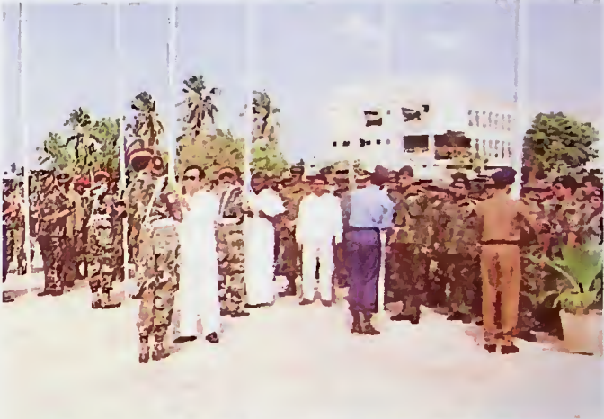
නියෝජ්‍ය ආරක්ෂක අමාත්‍ය ජෙනරාල් අනුරුද්ධ රත්නසේන මහතා සාමන්‍ය සිංහ ධජය පියවීමේදී

සෙවීමේ ස්ථාවර කොමිෂන් සභාවක් පිහිටුවීම ඊළඟ පියවර වූ අතර, එය මින් පෙර කිසිදු රජයක් යටතේ ජන ජීවිතය හා සමාජය පවිත්‍ර කිරීම සඳහා නොගත්තා ලද ඡන්දමේ විශේෂ සිද්ධියක් විය. ඒ යටතේ අල්ලය කොමසාරිස් කනකුර අනෝසි වී, අධ්‍යක්ෂ ජනරාල් පදවියක් පිහිටුවනු ලැබිණි. ඒ යටතේ තවු පැවරීමේ තීරණ පෙරදී මෙන් නිකිපතිවරයාට නොව අල්ලය කොමිෂමේ අධ්‍යක්ෂ හා පිහුණේ නිලධාරී මණ්ඩලයට පවරා දෙන ලදී. මේ පනතින්ම අල්ලය සඳහා දෙන දඩුවම් වැඩි කරන ලද අතර, අල්ලය චෝදනා ලබන පුද්ගලයන් ද එක සොහුවට නොගෙන, වර්ග කොට විලුහ කිරීම ද සිදු කර ඇත.