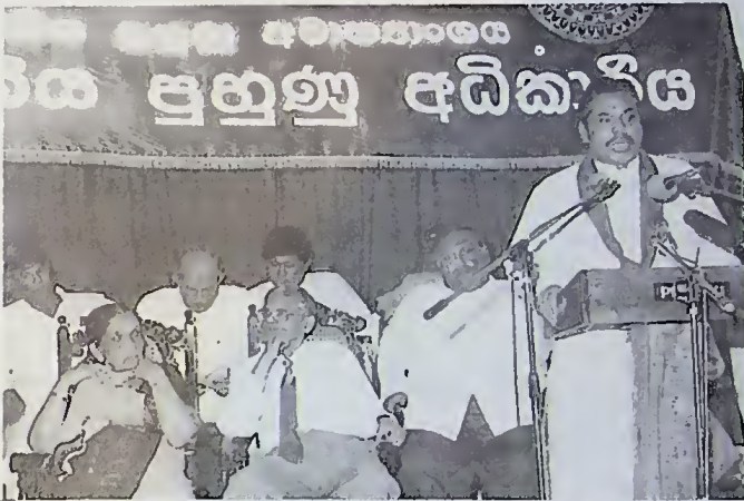
කම්කරු හා වෘත්තීය පුහුණු අධිකාරිය පිහිටුවීම

යෑම විෂය ක්ෂේත්‍රයකටම ගැලපෙන පරිදි 5 වසරේ ශිෂ්‍යත්ව විභාගය නැවත සංශෝධනය කිරීමට කටයුතු යොදා ඇත. මෙය 1994 සිට ක්‍රියාත්මක වේ. 1995 වසරේ දී සිසුන් 10,000 දෙනෙකුටම 5 වසරේ ශිෂ්‍යත්ව ප්‍රදානය කෙරිණ. මෙය 1996 දී 15,000 දක්වා ඉහළ නැංවේ.