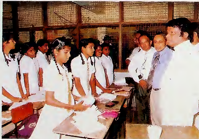
3වන පසිරණ ඇමතිවරයා පාසැලක පිළුන්ගේ අවශානා සොයා බලමින්

එහෙත් පසුගිය රජය මෙම විශේෂිත සාක්ෂරතාවය කෙරෙහි ප්‍රමාණවත් සැලකිල්ලක් දක්වා නැත. එසේම විද්‍යාව, ගණිතය ආදී අංශ මගින් නව තාක්ෂණයෙන් යුතු ආර්ථිකයක් කරා ගමන් කිරීමට ඉතා ප්‍රයෝජනවත් වන මෙම සාක්ෂරතාවය උපයෝගී කරගැනීම කෙරෙහි පසුගිය රජය දක්වා ඇති උනන්දුව ඉතාමත් කණගාටුදායකය.