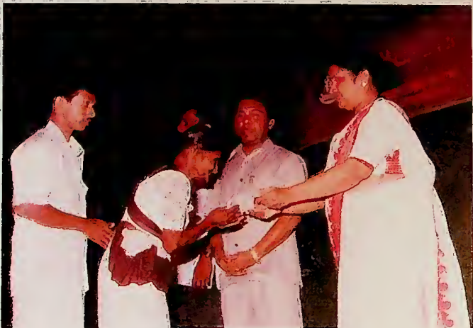
සමෘද්ධි වැඩ සටහනේ දෙවන පියවර ආරම්භ වූ ද . . .

1995 වසරේ ශ්‍රී ලංකාවට පැමිණි මුළු සංචාරකයින් සංඛ්‍යාව 403,101 ක් වේ. 1993 දී පැමිණි 392,290 හා 1994 පැමිණි 407,511 සංඛ්‍යාව හා සසඳන කල සැලකිය යුතු වර්ධනයක් දැකිය හැකි ය. 1994 වඩා 1995 වසරේ සංචාරකයින්ගේ පැමිණීම ඉතා සුළු වශයෙන් අඩු වී ඇත්තේ ජනවාර්ගික යුද්ධය, බෝම්බ පිපිරීම වැනි දේ නිසා ය. ශ්‍රී ලංකාවේ ජනවාර්ගික යුද්ධය නිසා මෙරටට සංචාරකයින්ගේ පැමිණීම බෙහෙවින් අඩුවී ඇතැයි ජනමාධ්‍ය වලින් කෙරෙන ප්‍රචාරය මෙ මගින් අසත්‍ය වේ. මෙයින් වැඩිම සංචාරකයින් කොටසක් පැමිණ ඇත්තේ බටහිර යුරෝපය, ජර්මනිය, එංගලන්තය, ප්‍රංශය, ජපානය වැනි ආසියාතික රටවල් වලින්ය.