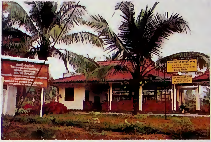
නොවි සෙවන පිහිටුවීම

කෘෂිකර්මාන්තය ශ්‍රී ලාංකිකයින් වැඩි දෙනෙකුගේ අදක් ප්‍රධාන ජීවන වෘත්තියයි. පසුගිය කාලයේ දී ගොවියාගේ ජීවන පැවැත්ම කෙරෙහි ප්‍රමාණවත් අවධානයක් යොමු නොවීය. ඒනිසා වත්මන් රජය කෘෂිකර්ම අංශයට කඩිනම් සහන ලබාදීම, එසේම ගොවීන්ගෙන් අයවිය යුතු බැංකු ණය අවලංගු කිරීම, ණය මුදල් ප්‍රදානය කිරීම, පොහොර සහනාධාරය යළි ස්ථාපිත කිරීම සහ වී මිළදී ගැනීමේ මණ්ඩලය නැවත ප්‍රතිසංවිධානය කිරීම වැනි ක්ෂණික පියවරවල් පසුගිය වසර දෙක තුළ දී ගන්නා ලදී. දිගුකාලීන පියවර අතර රජය විසින් හඳුන්වාදෙන ලද 'අමා' වැඩ සටහන වැදගත් විය. ගොවි සෙවන, ගොවිජන බැංකුව, ගොවියෙකු ලොකරැයිය මේ යටතේ ස්ථාපිත විය. කෘෂිකර්ම රක්ෂණ ක්‍රමය ප්‍රතිසංස්කරණය කළේය. ඒ යටතේ ගොවීන්ට ප්‍රසාද දීමනා වැඩි කළා පමණක් නොව ගොවියා ගෙන් පසුව ඔහුගේ භාරයාවට ඒ ප්‍රතිලාභ ලැබීමේ ක්‍රමයක් ඇති කෙරුණි.