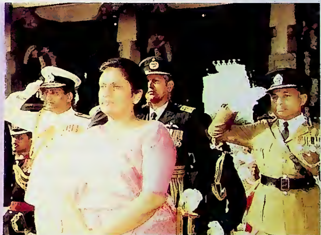
ජනාධිපතිවරයා නිදහස් උදෙසා උත්සාහවාරය පිළිගනිමින්

1995 ජනවාරි 6 වෙනිදා පාර්ලිමේන්තුවේ නව සැසි වාරය විවෘත කරමින් ජනාධිපතිවරයා මේ රටේ ප්‍රජාතන්ත්‍රය තැවත ස්ථාපිත කිරීමේ කාර්යය ගැන කළ ප්‍රකාශය දැන් යථාර්ථයක් බවට පත් වී තිබේ. එකුමිය සිය කතාවේදී මෙසේ සඳහන් කළාය.