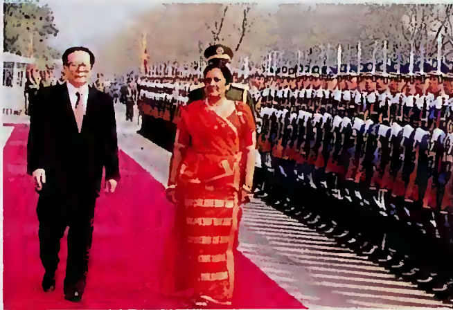
ජනාධිපතිනිය චීනයේ දී උත්සවාංගය සිලිනෙහි

චීන රජයේ ආයෝජකයන් ශ්‍රී ලංකාවට ගෙන්වා ගැනීමට ජනාධිපතිනිය එම රටේ ආයෝජකයන් සමඟ කළ සාකච්ඡා බෙහෙවින්ම එලදායක වූයේය. ඔවුන් බොහෝ දෙනෙකු ශ්‍රී ලංකාවේ ආයෝජනය කිරීමට කැමැත්ත දැක්වූ අතර, දැනටමත් ආයෝජන මණ්ඩලය මගින් චීන ආයෝජකයන් 71 දෙනෙකුට මේ සඳහා අනුමැතිය දී ඇත. ස්වර්ණාභරණ සෑදීම, ගැඹුරු මුහුදේ මසුන් ඇල්ලීම, බයිසිකල් සෑදීම, ඉස්සන් නිෂ්පාදනය, සිමෙන්ති හා රබර් නිෂ්පාදනය ඔවුන් ඇරඹීමට අපේක්ෂා කරන ව්‍යාපාරයන් ය.