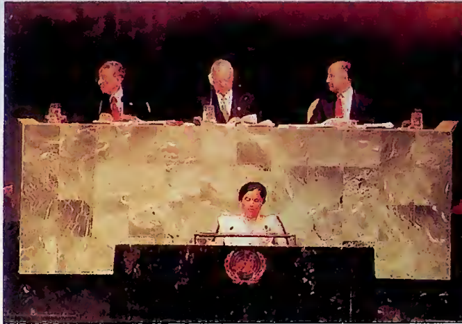
ශ්‍රී ලංකා ජනාධිපතිතුමා එක්සත් ජාතීන්ගේ සංවිධානය අමතමින් . . .