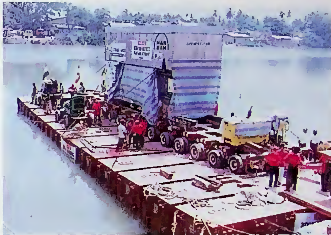
තව වදුලි උත්පාදන යන්ත්‍රය කැලණි ගඟෙන් එතොටට ගනිද්දී

පොදු ජනතාවට මෙන් ම විවෘත ආර්ථික ක්‍රමයක් කරා ගමන් කෙරෙන ශ්‍රී ලංකාව වැනි රටකට ඉතා