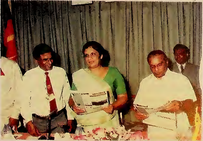
ජාතික තොරතුරු මධ්‍යස්ථානය විවෘත වූ දින . . . .

භීෂණය නැතිකොට ප්‍රජාතන්ත්‍රවාදී නිදහස යළි ස්ථාපිත කිරීම සඳහා පොදු ජන එක්සත් පෙරමුණු රජය ගත් අනෙක් අද්විතීය පියවර වන්නේ දේශපාලන සාකච්ඡා පිළිබඳව සොයා බැලීම සඳහා කොමිෂන් සභා පත් කිරීමයි. විජය කුමාරතුංග, ලලිත් ඇතුලත්මුදලි හා ඩෙන්සිල් කොබ්බෑකඩුව සහ