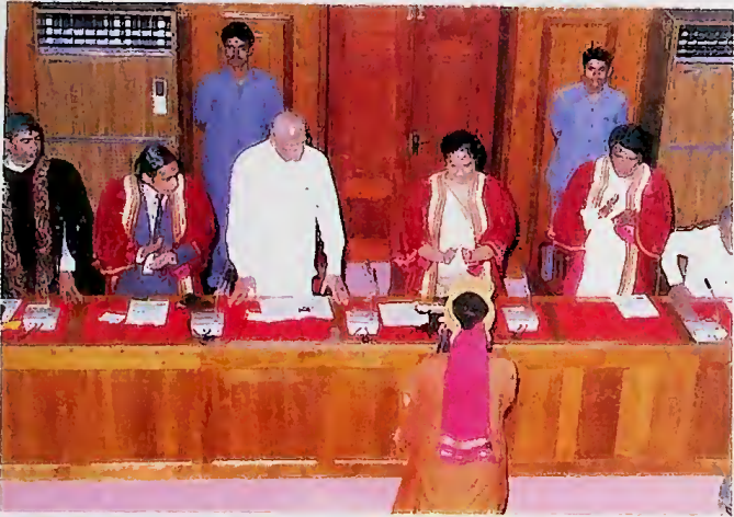
ශිෂ්‍යාලය විශ්ව විද්‍යාලය විවෘතවීම

ගුරුවරුන් පුහුණු කිරීම සඳහා නව රජයේ විශේෂ අවධානයක් යොමු වී ඇත. මඩකලපුවේ නව ගුරු අධ්‍යාපන පීඨයක් විවෘත කොට ඇත.. 1995 වසරේ දී ගුරු පුහුණුව සඳහා බඳවා ගන්නා ලද 1939 ක් වූ සිසුන් සංඛ්‍යාව 1994 වසරේ දී බඳවා ගන්නා ලද සිසුන් සංඛ්‍යාවට වඩා 436 ක වැඩිවීමකි. එසේම ගුරු පුහුණුව සඳහා 1995 දී ගත් සිසුන් සංඛ්‍යාව 1956 කි. 1996 වසරේ දී බඳවා ගන්නා ලද සිසුන් සංඛ්‍යාව 866 කින් වැඩිවීමකි. මෙය ඉදිරියේ දී තවත් වැඩි කරනු ඇත. ගුරු පුහුණු වැඩ සටහන් ක්‍රමානුගතව සම්බන්ධීකරණය කිරීම පිණිස " ජාතික ගුරු පුහුණු අධිකාරියක් " පිහිටුවීමට ද පියවර ගෙන ඇත.