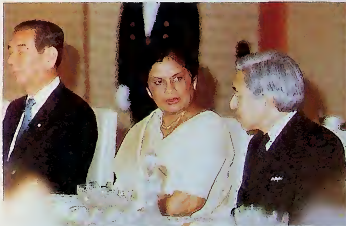
ජනාධිපතිතුමා ජාත් අධිරාජ්‍යා සමඟ

සෙවීමට ශ්‍රී ලංකාවේ නව රජයට සැබෑ අවශ්‍යතාවක් ඇති බවත්, එල්.ටී.ටී.ඊ සංවිධානයේ අනාමය පිළිවෙත් හා කුරිරු මිනිස් ඝාතන ඊට ප්‍රධාන බාධකය බවත් අන්තර්ජාතික ප්‍රජාව පිළිගන්නට වූහ. ඇමෙරිකානු රාජ්‍ය