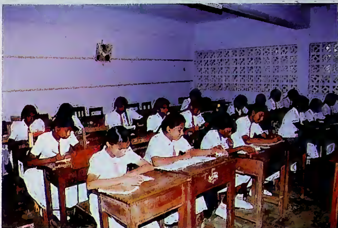
සාපුලක දරු දැරියෝ

(ඉ) අවශ්‍ය ප්‍රති සංවිධානයන් සිදුකොට රටේ කර්මාන්තවලට අදාළ රැකියා සඳහා අවශ්‍ය දස්කම් ප්‍රගුණ කරන්නාවූත්, උසස් මට්ටමේ පර්යේෂණ කටයුතු හා වෘත්තීය විශේෂඥතා පෝෂණය කරන්නාවූත් ක්‍රමයක් බවට අධ්‍යාපනය පත් කිරීම.