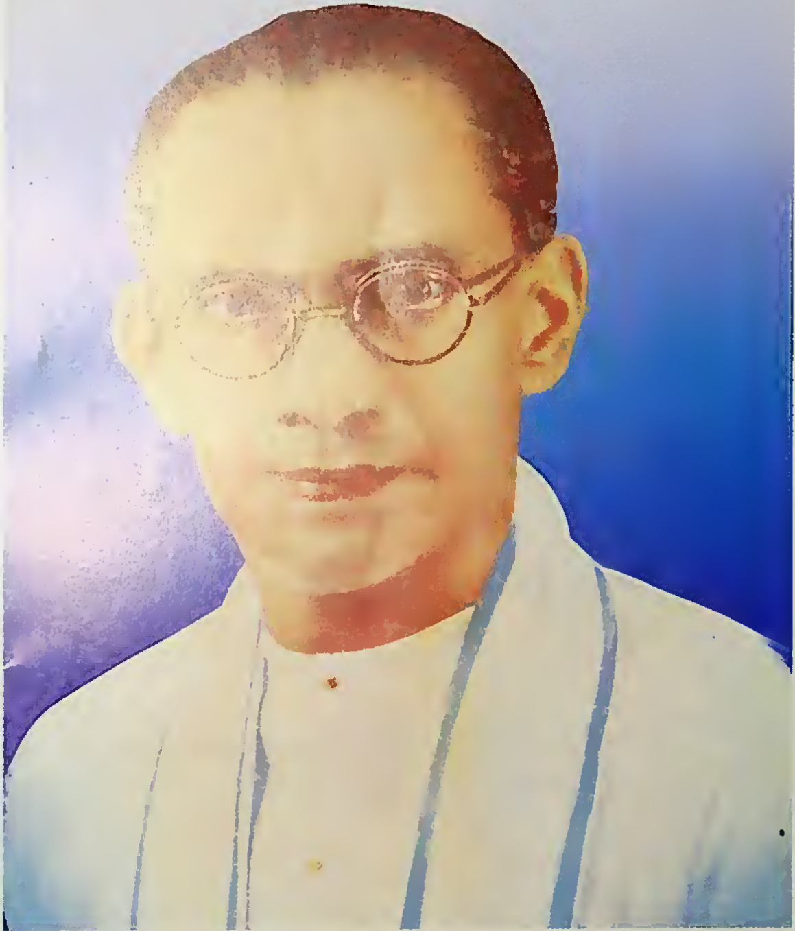
දේශයේ අසහාය ජන නායක දිවංගත අග්‍රාමාත්‍ය ගරු එස්. ඩබ්ලිව්. ආර්. ඩී. බණ්ඩාරනායක ශ්‍රීමතාණෝ