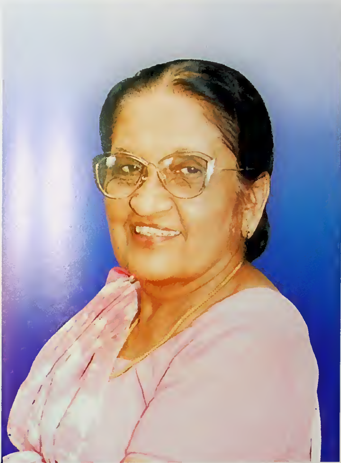
ජාතියේ මාතාව, ලොව ප්‍රථම අගමැතිනිය දිවංගත අග්‍රාමාත්‍ය ගරු සිරිමාවෝ බණ්ඩාරනායක මැතිනිය