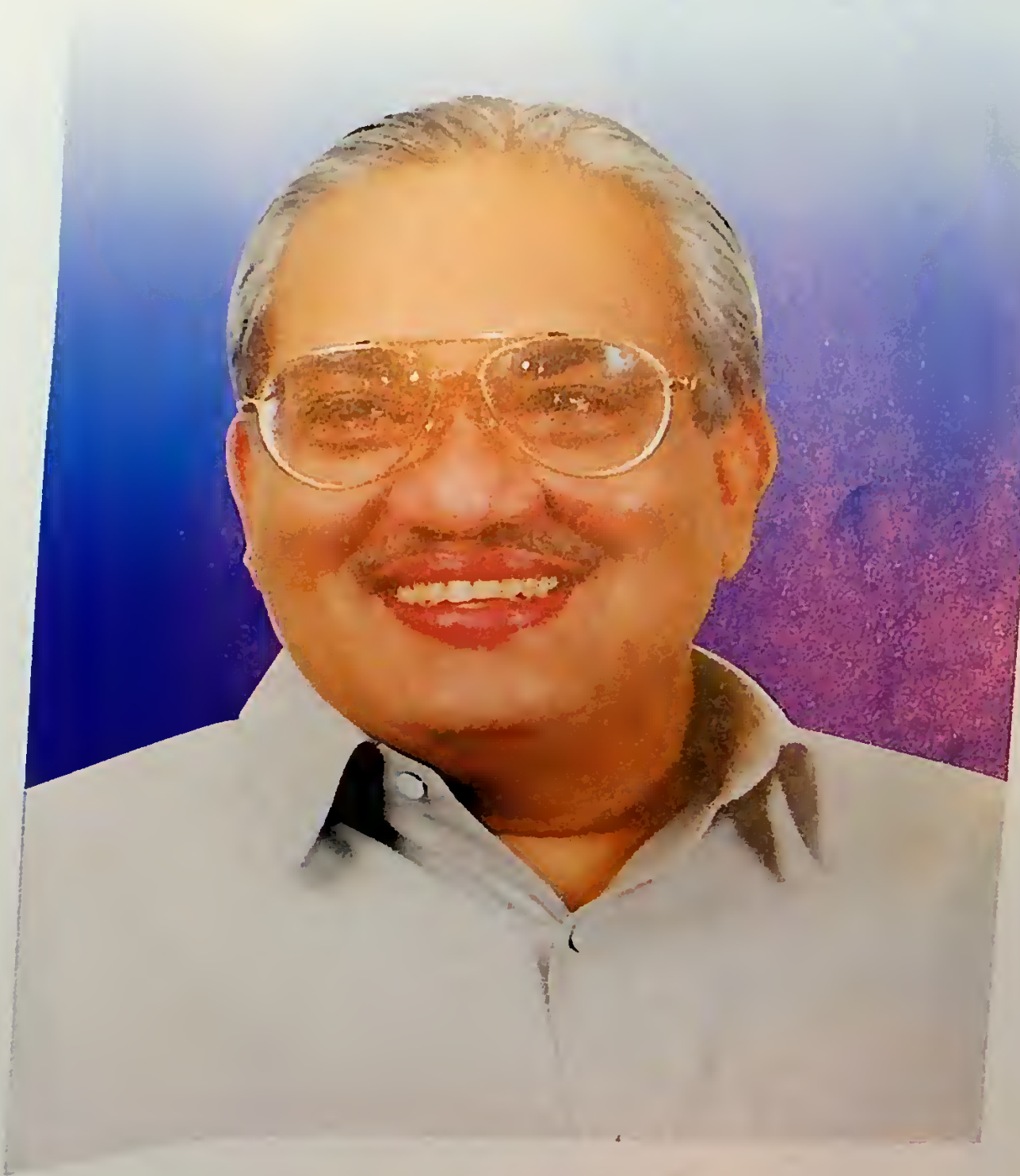
2004 ජනතා ජයග්‍රහනය... එක්සත් ජනතා නිදහස් සන්ධානයේ නිර්මාතෘ ගරු අමාත්‍ය සර් ජයරත්න වික්‍රමසිංහ