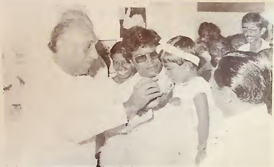
ජනාධිපතිතුමා කුඩා දරුවෙකුට කිරි කෝප්‍රසක් පොවමින්