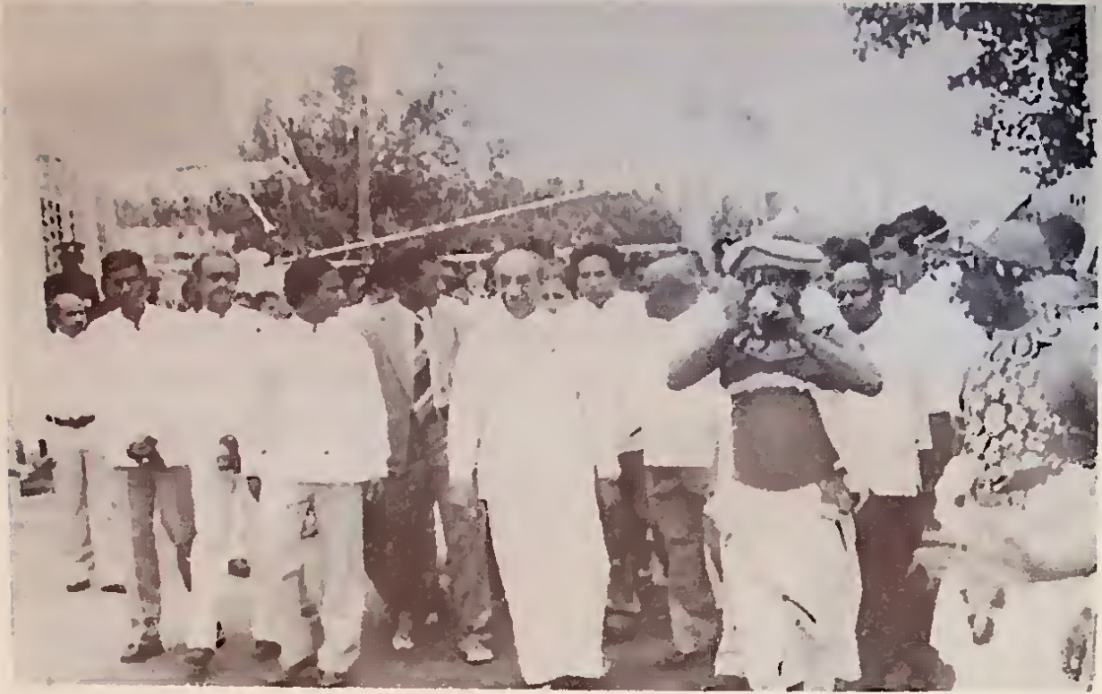
ජනාධිපතිතුමා වසර සංස්ථාවේ රැස්වීමේ සාලාව කරා පැමිණෙයි