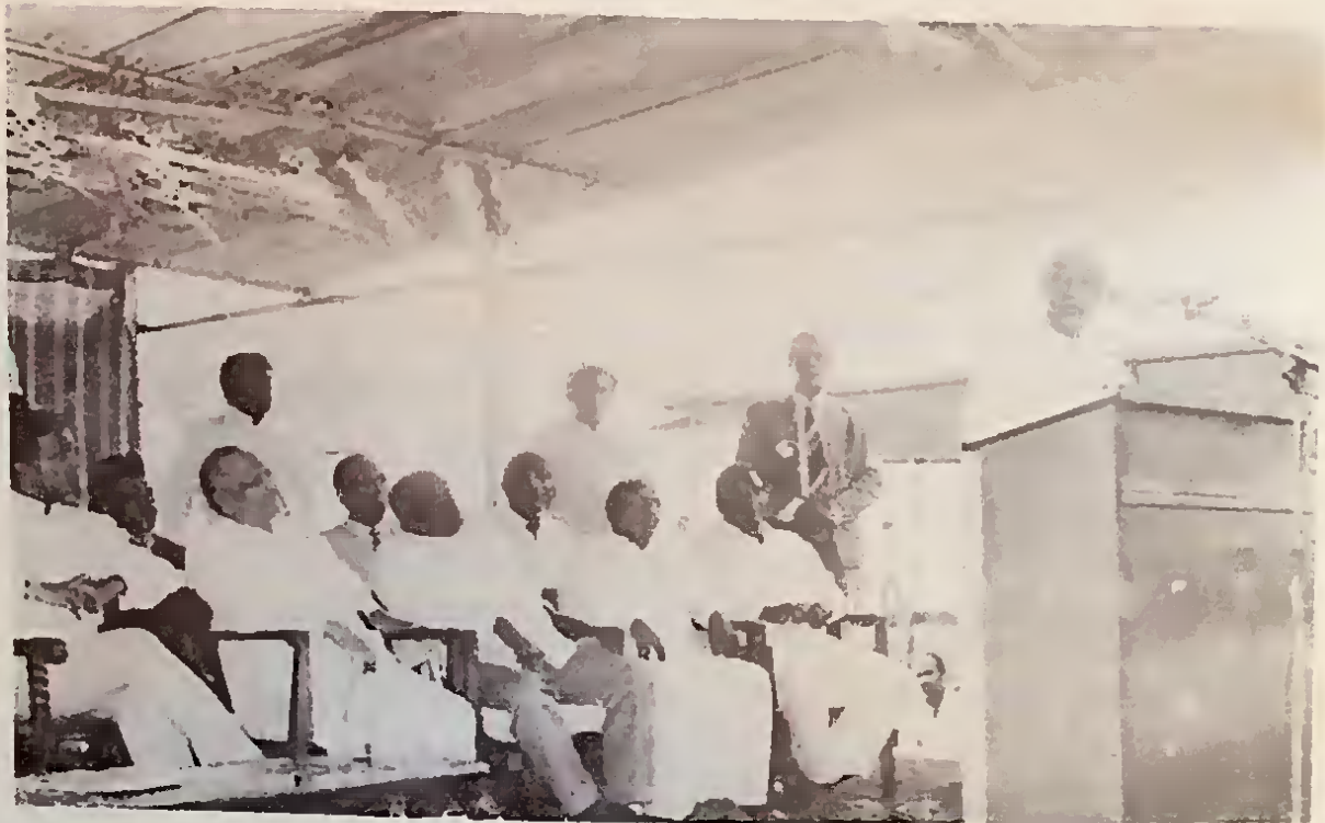
වසර සංස්ථාවේ රැස්වීමේ අමතයි